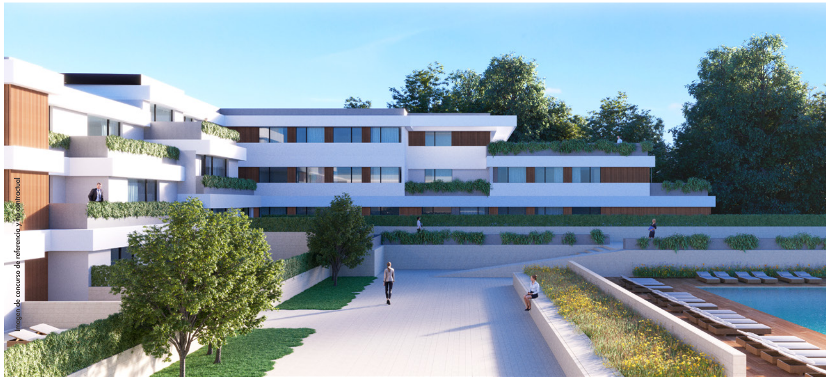
VIVIENDAS COLECTIVAS EDIFICIO 1