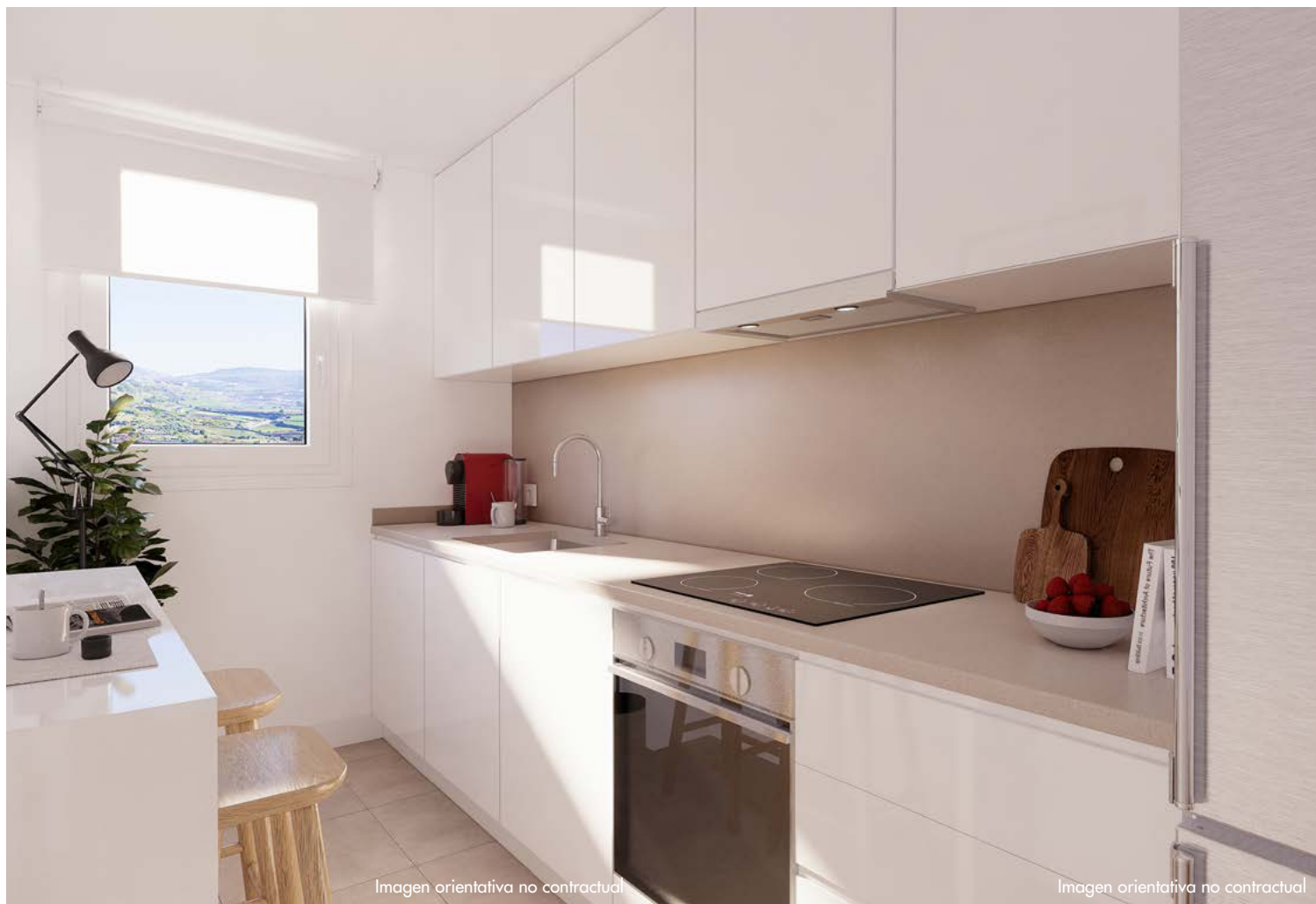
Imagen orientativa no contractual