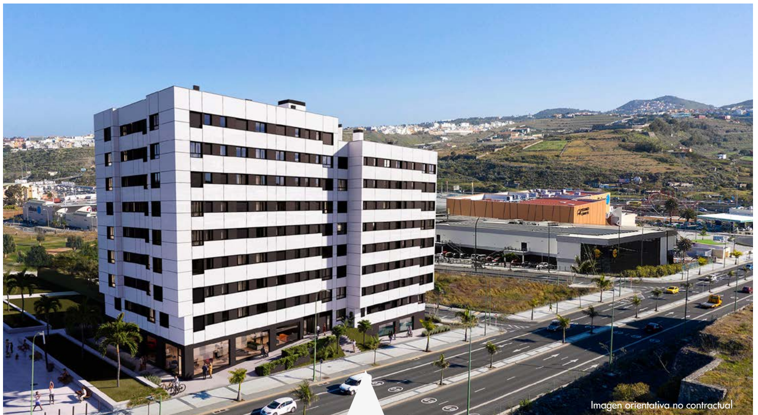
Imagen orientativa no contractual

Tamaraceite Sur es la oportunidad de empezar una nueva vida en Las Palmas de Gran Canaria, frente al Centro Comercial Alisios.