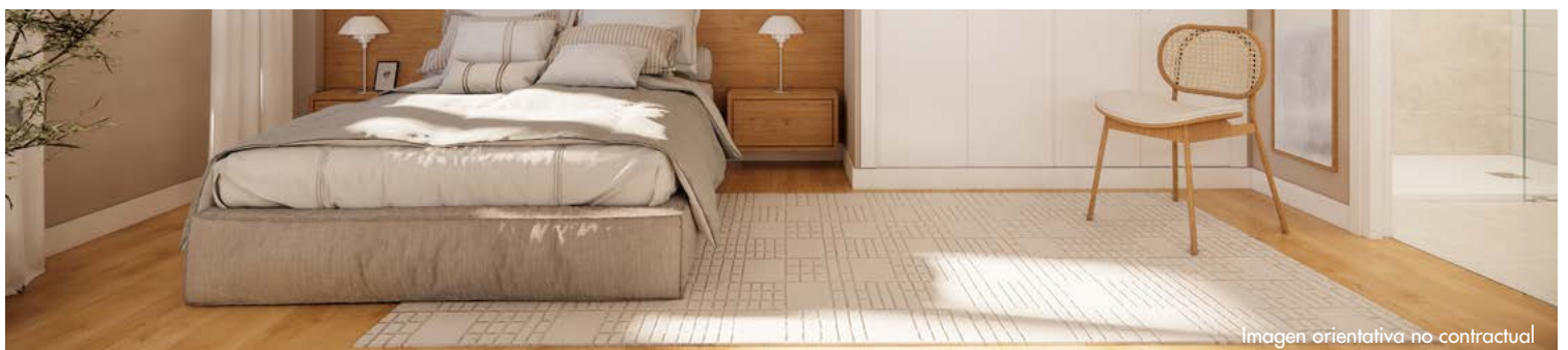
Imagen orientativa no contractual