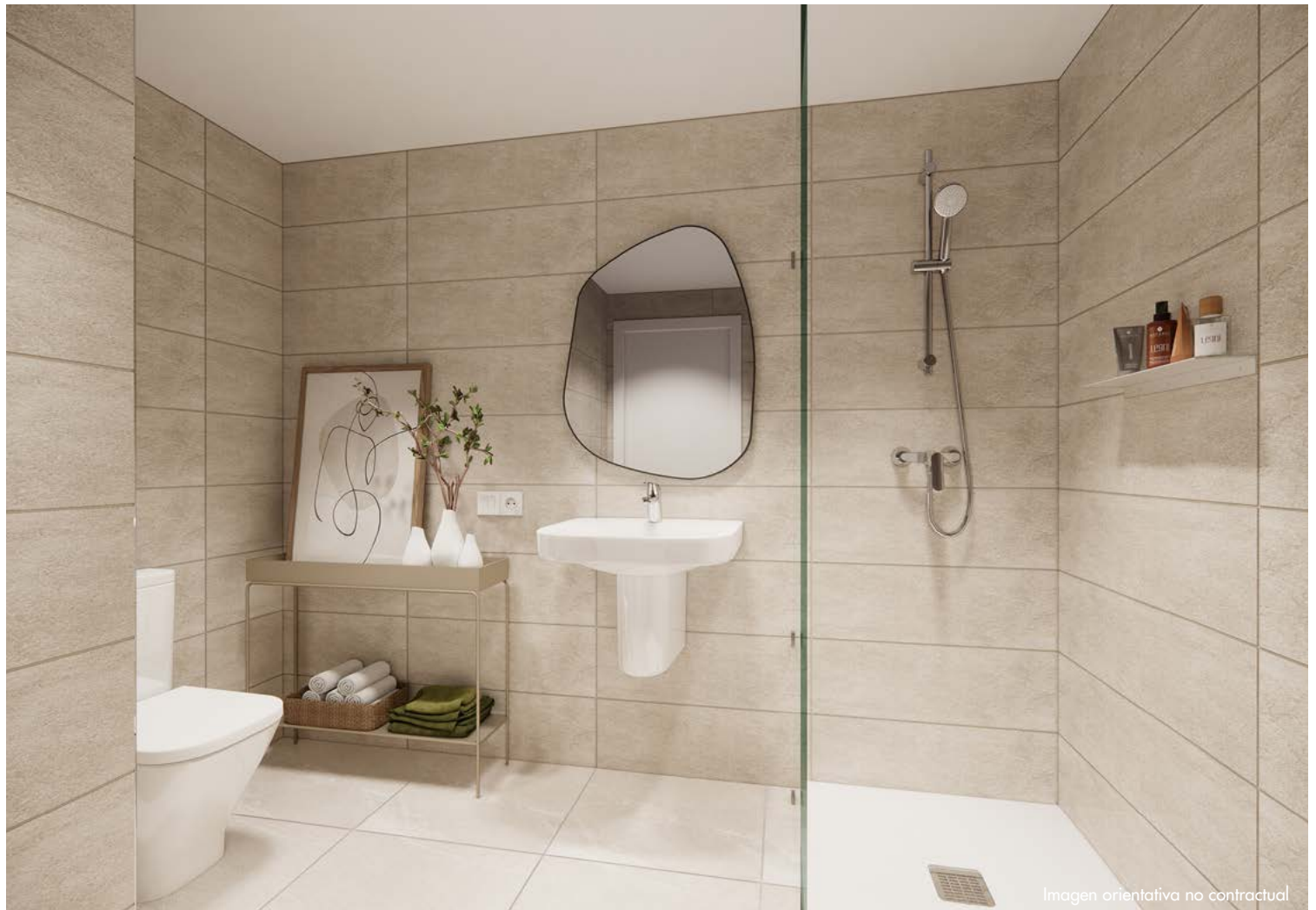
Imagen orientativa no contractual