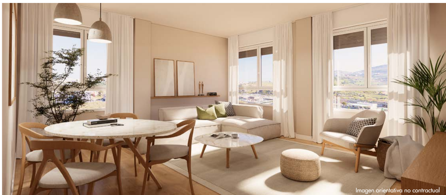
Imagen orientativa no contractual

Certificado de Eficiencia Energética disponible en la Oficina comercial así como en el apartado de "Descargas" de la ficha de la promoción de www.avantespacia.com Cualquier variación que pudiera producirse entre el Certificado de Eficiencia Energética del proyecto y el Certificado de obra terminada no afectará a la letra indicada en la Calificación Energética.