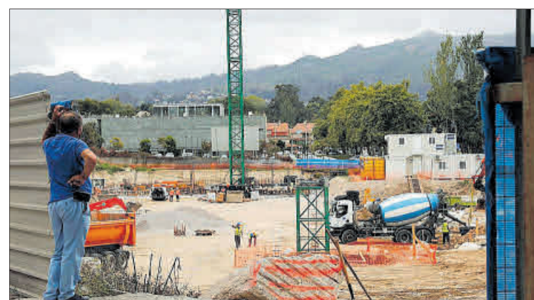
Construcción del hotel Attica 21 Vigo Business & Wellness.

Inveravante, mientras, mantiene sus otros planes en la ciudad, como la promoción de Marqués de Valladares, que sigue quemando etapas; y la de construcción de otro bloque residencial en Tomás Alonso, otra zona llamada a humanizarse en el futuro.