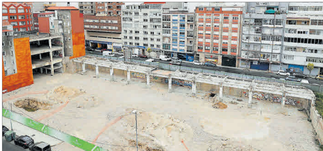
Solar antes ocupado por Cordelerías Mar donde se construirá la promoción de 155 pisos.

de la web de Avantespacia, si bien otros alcanzan los 338.000 euros, en su caso, con cuatro dormitorios. Aun sin comenzar la construcción, la comercialización “está tirando bien”, apuntan fuentes consultadas,