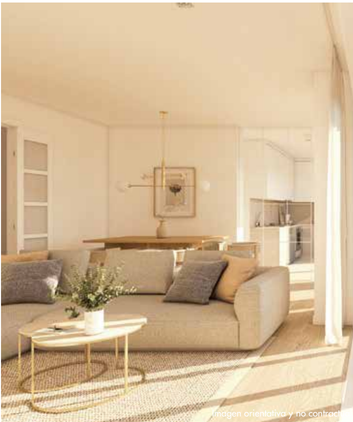
Imagen orientativa y no contractual

Se instalan falsos techos con registros, donde sea requerido por las instalaciones.