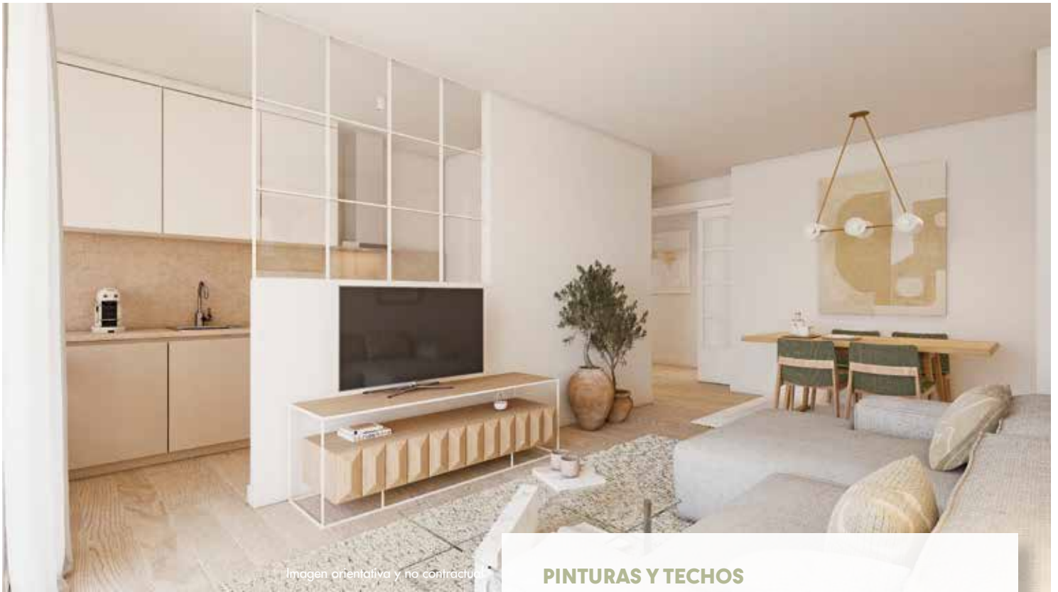
Imagen orientativa y no contractual