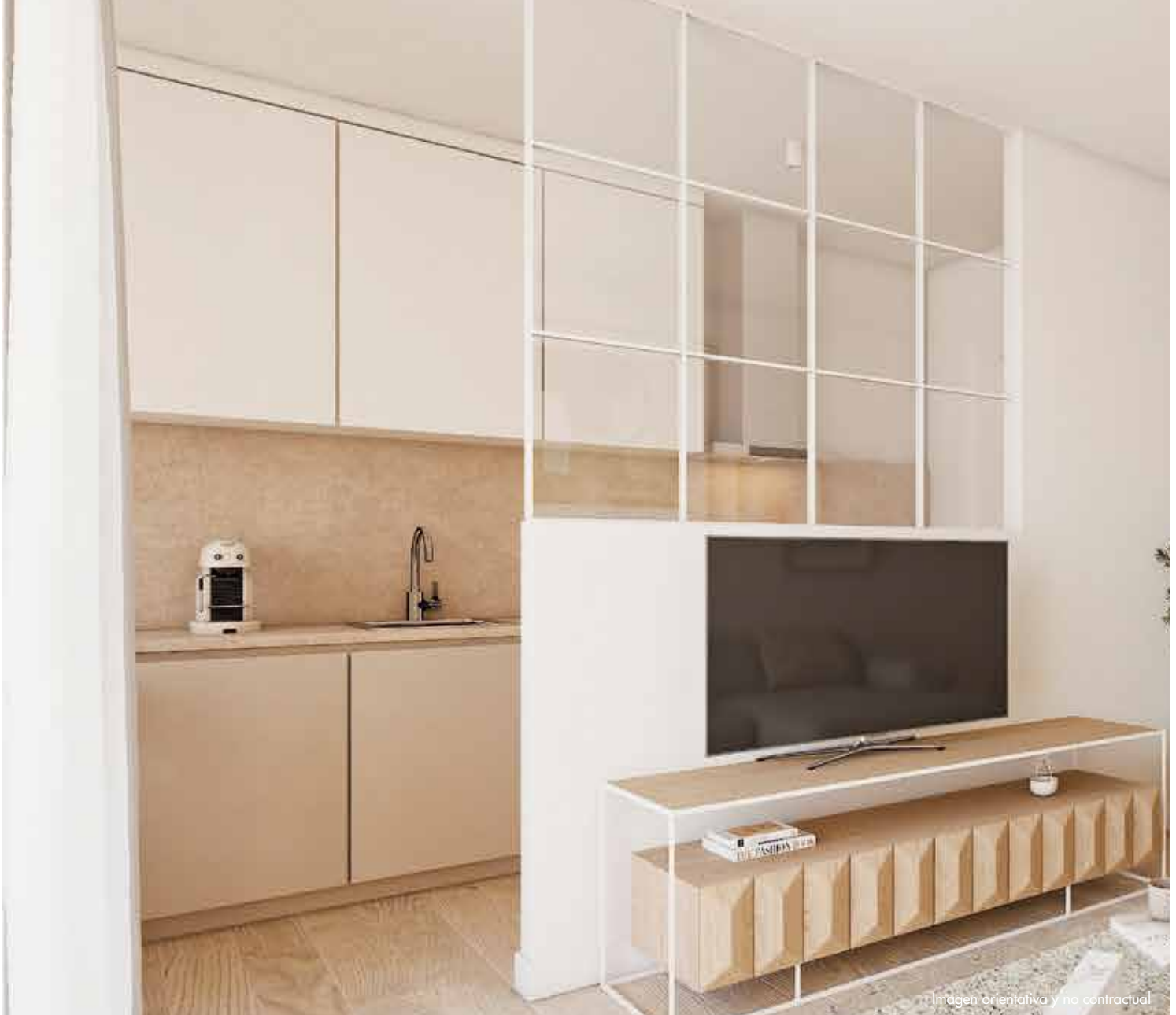
Imagen orientativa y no contractual

Se equipan con los siguientes electrodomésticos Balay color inox, según tipología: frigorífico combi, placa de inducción, campana extractora y horno o campana extractora decorativa/integrada y torre en horno