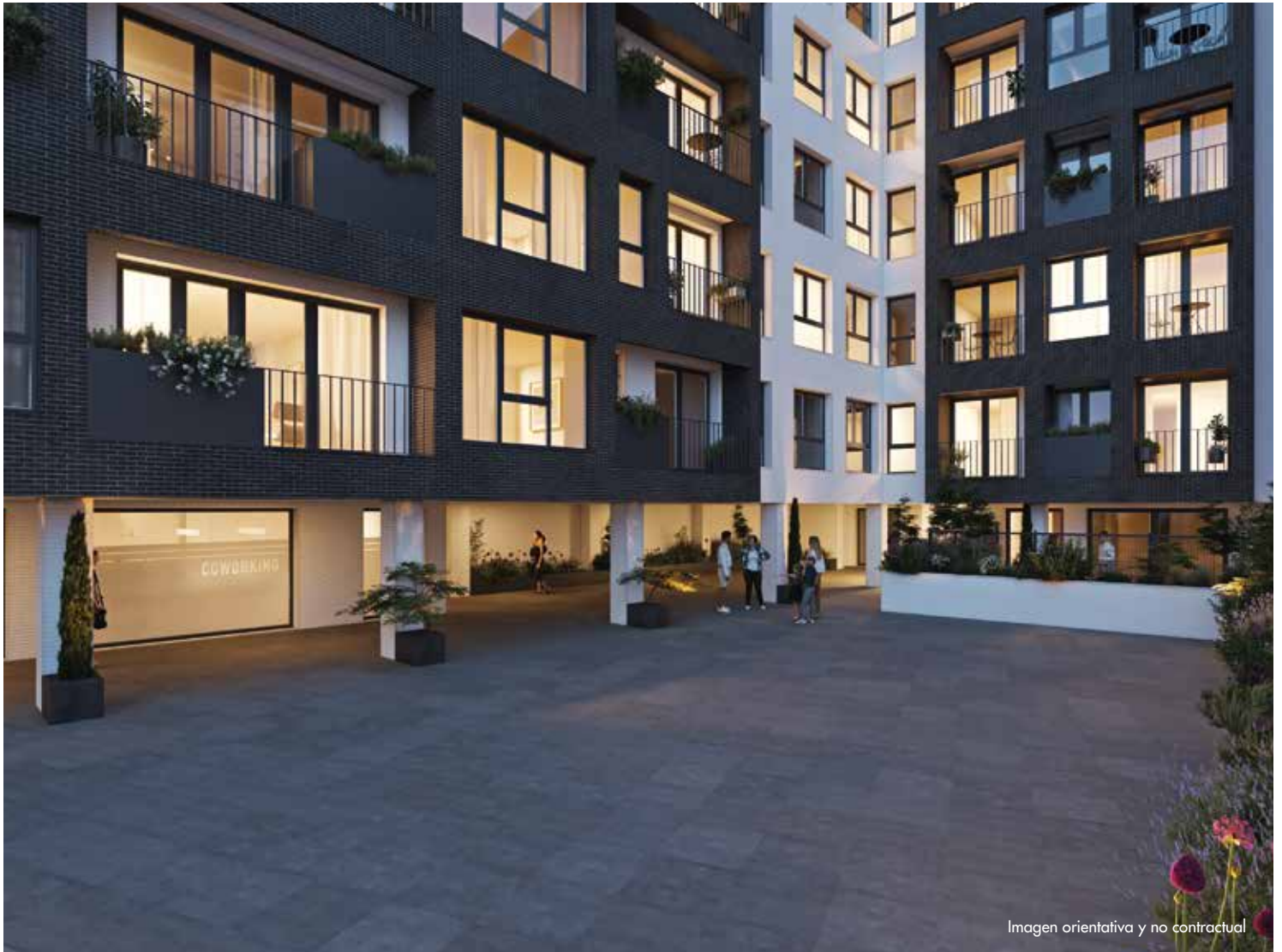
Imagen orientativa y no contractual

Plaza de la Lila se sitúa en una de las mejores zonas de Oviedo. Se trata de un complejo residencial de arquitectura contemporánea que combina a la perfección la tranquilidad de Plaza de la Lila con el dinamismo y prestaciones de General Elorza.