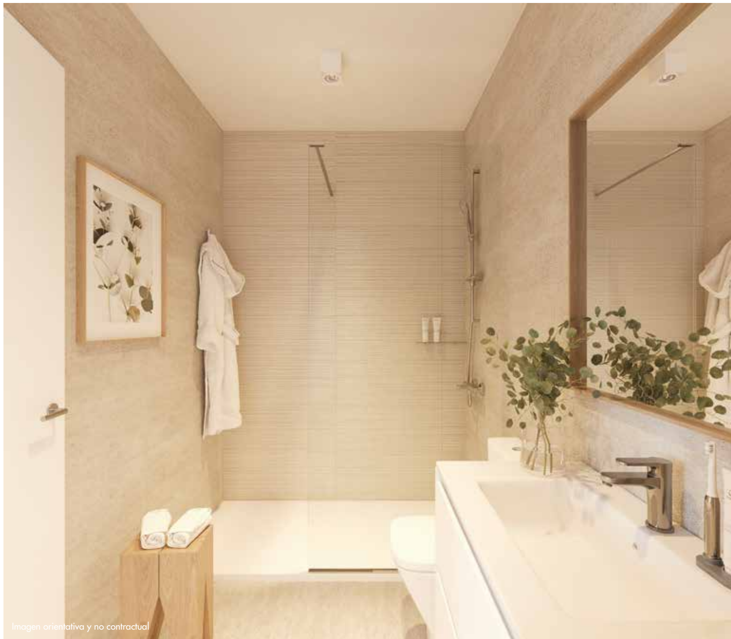
Imagen orientativa y no contractual

Los aparatos sanitarios también son de la marca PORCELANOSA con griferías de la marca GROHE. En duchas y bañeras se instalan griferías termostáticas.