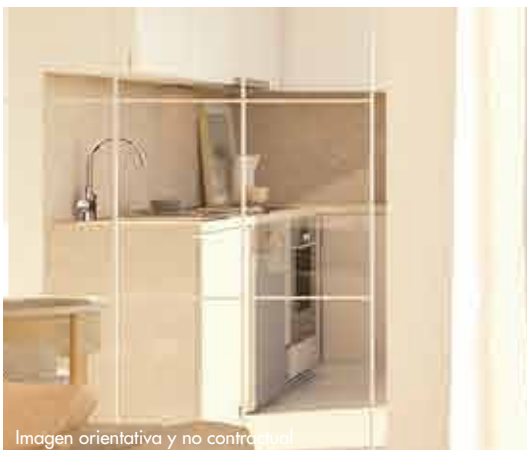
Imagen orientativa y no contractual

Las cocinas se pavimentan con gres porcelánico de la marca PORCELANOSA y rodapié a juego.