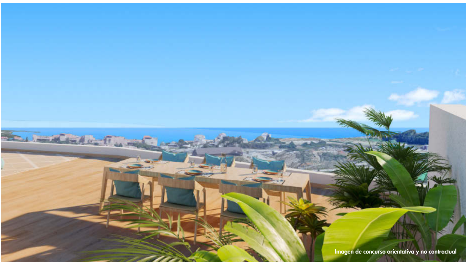
Imagen de concurso orientativa y no contractual

ONE80 Suites es una urbanización privada con piscina y espacios ajardinados, excelentemente situada en Estepona, una zona codiciada de la Costa del Sol.