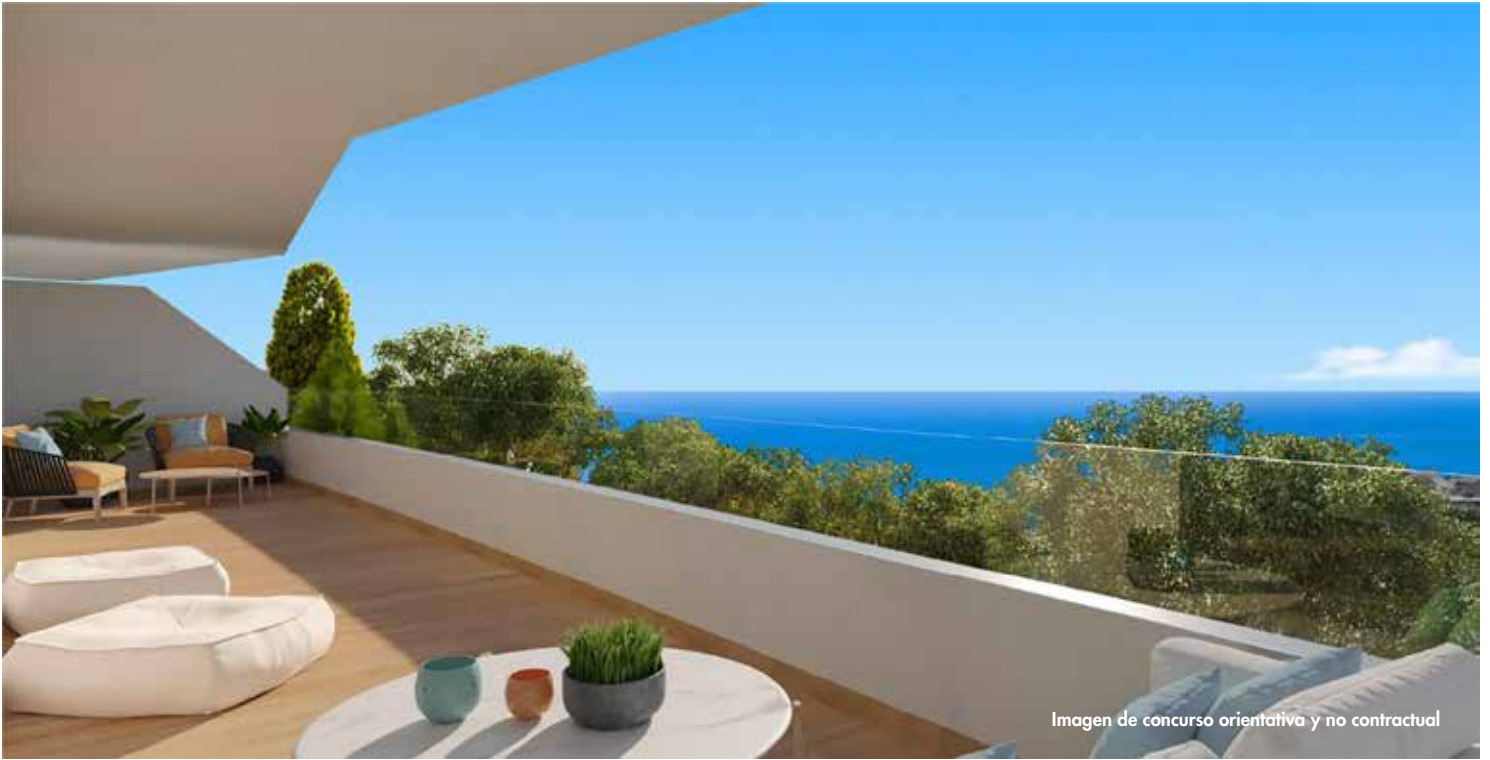
Imagen de concurso orientativa y no contractual