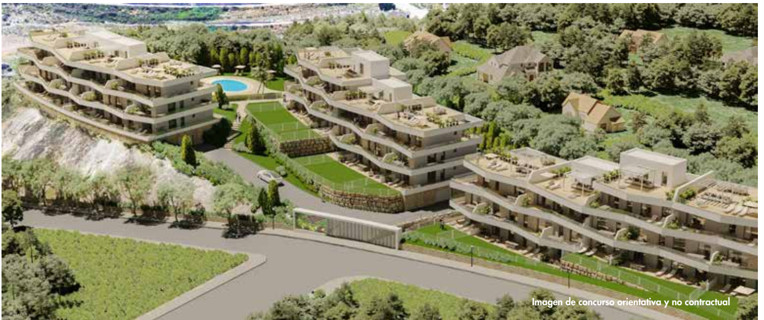
Imagen de concurso orientativa y no contractual