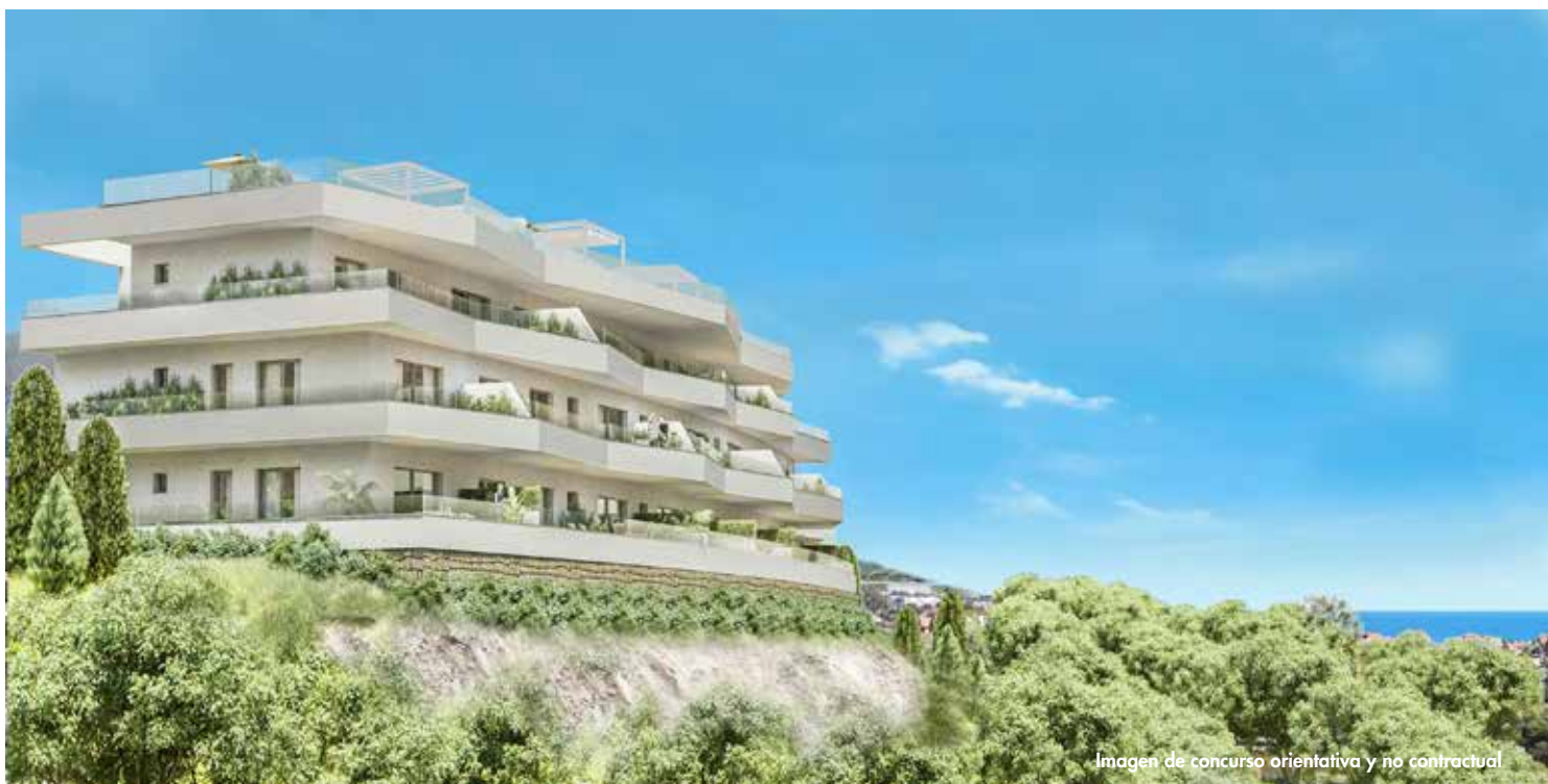
Imagen de concurso orientativa y no contractual