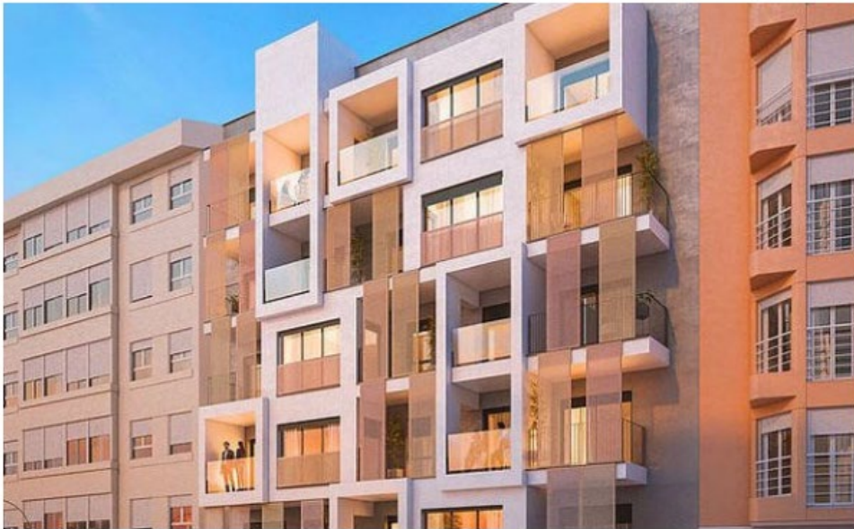
Recreación de la fachada del proyecto residencial de Avantespacia.

Avantespacia construirá un edificio para 40 pisos en un solar situado en la calle Peso de la Harina