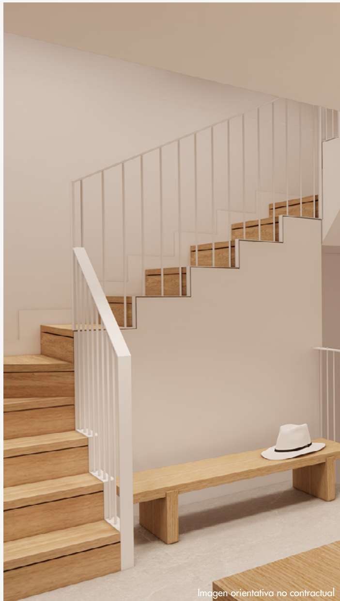
Imagen orientativa no contractual