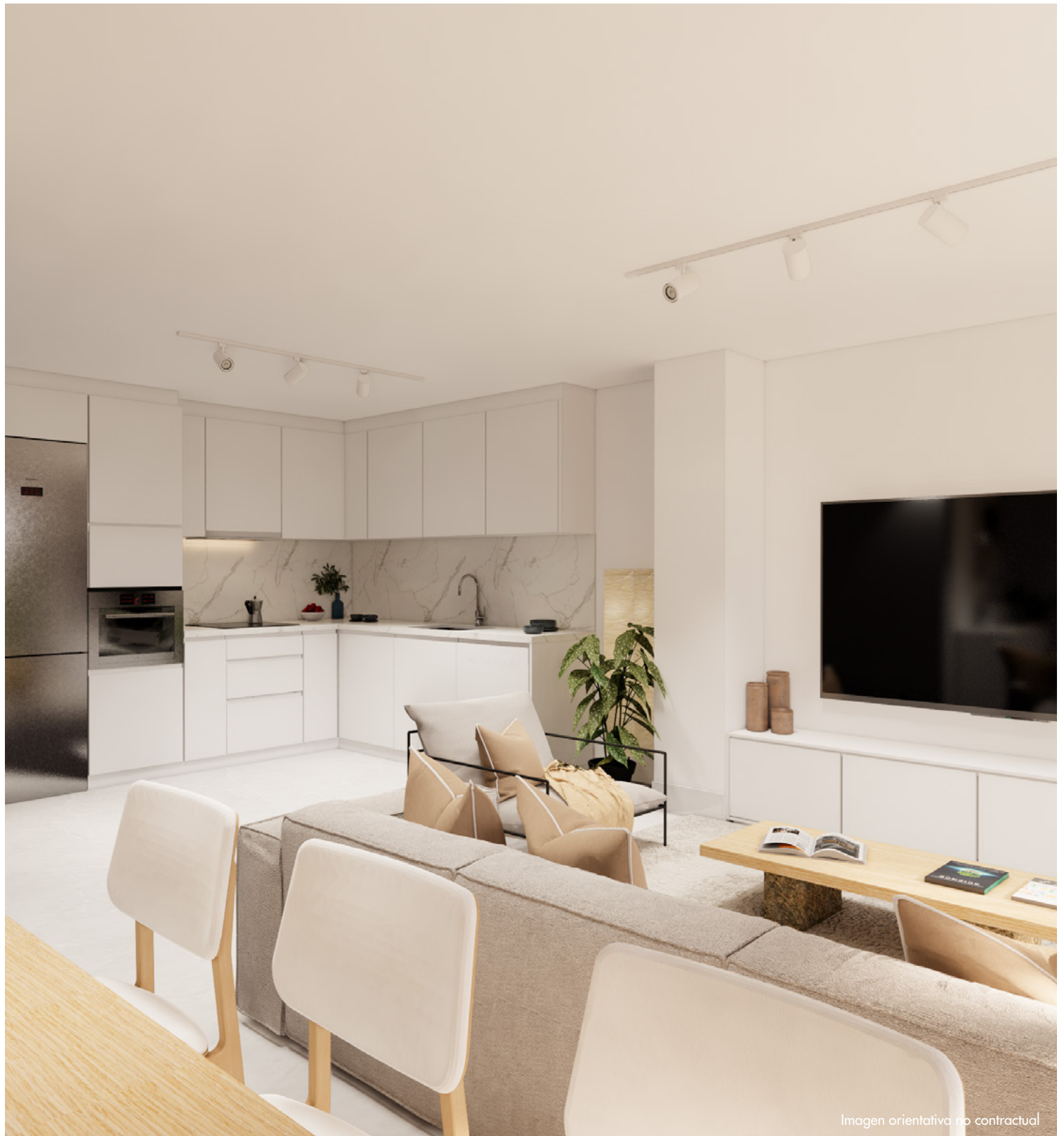
Imagen orientativa no contractual

Construimos cumpliendo el Código Técnico de la Edificación y normativas vigentes de aplicación.