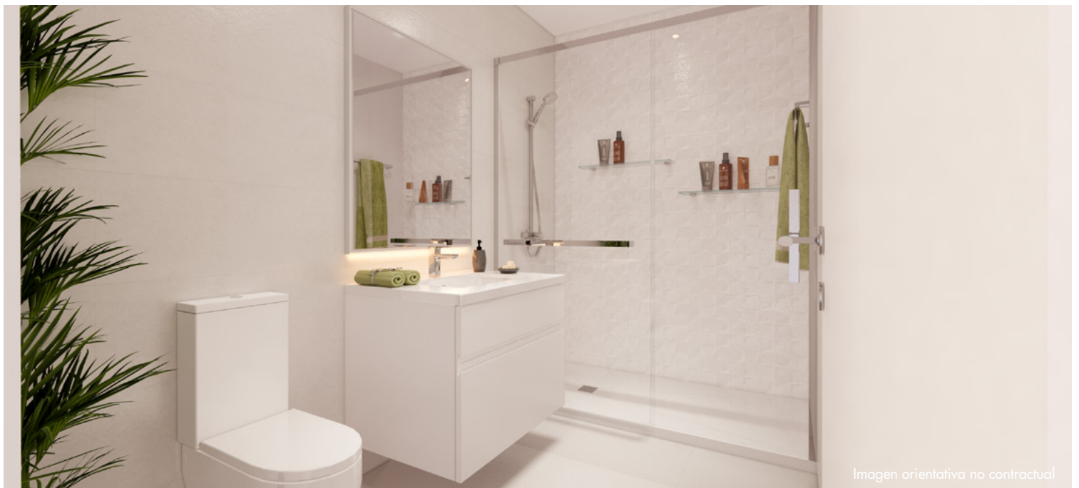
Imagen orientativa no contractual