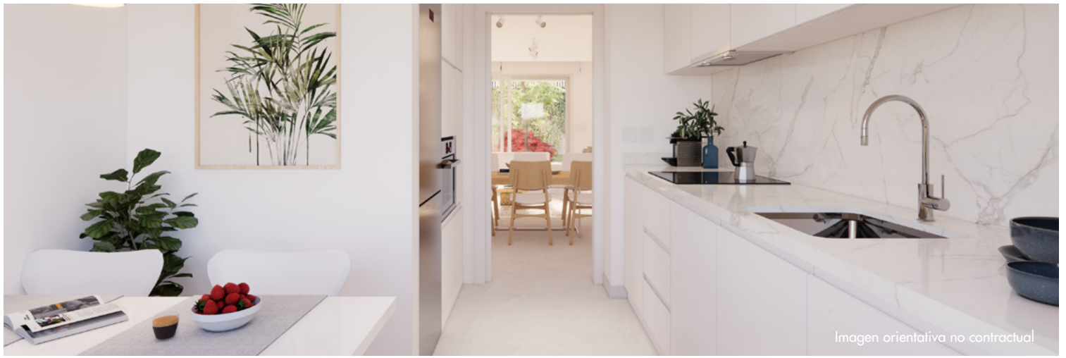
Imagen orientativa no contractual