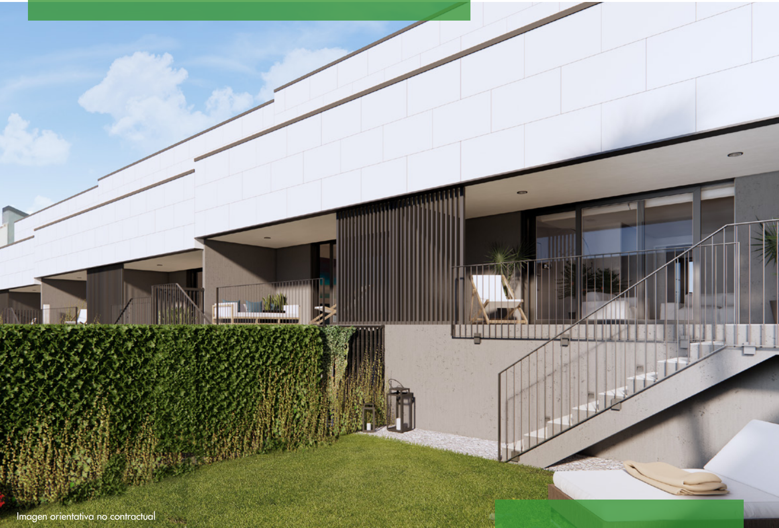
Imagen orientativa no contractual