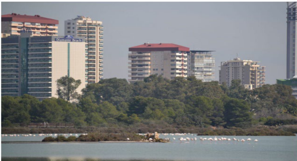
Edificios junto a les Salines de Calp (archivo)

Los 120 apartamentos que alojarán las tres torres estarán junto a la playa del Arenal-Bol, en un entorno de edificaciones próximo al parque natural del Penyal d'Ilfac. La tipología de las viviendas será la misma que la de las edificaciones cercanas.