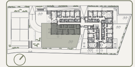
PORTAL 1 | PLANTA BAJA | B