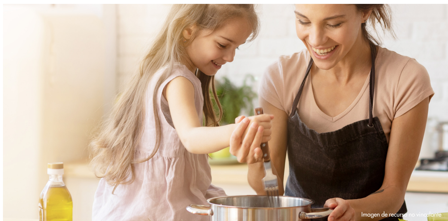
Imagen de recurso no vinculante